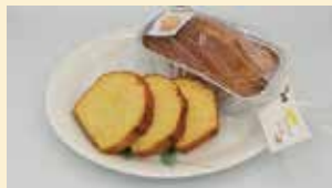
ドライブイン長谷川 「温泉パウンドケーキ」 (バナナ・さつまいも・プレーン)