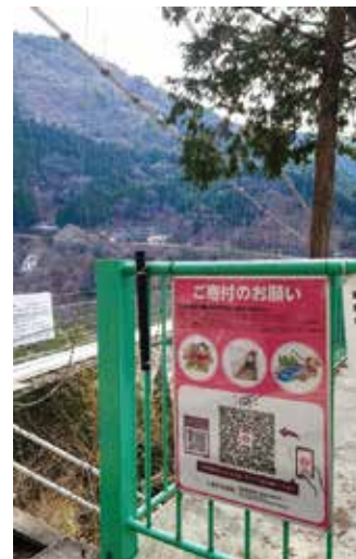
谷瀬の吊り橋に設置された看板▲