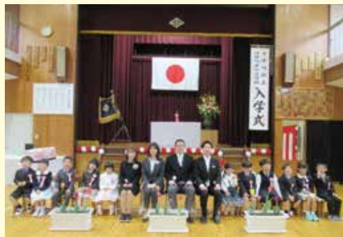
十津川第一小学校