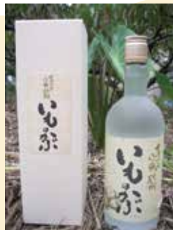
谷瀬地域受入協議会 「日本酒 谷瀬」