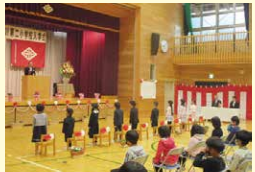
十津川第二小学校