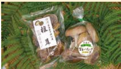
みやび農園 「生しいたけ」 「乾燥しいたけ」