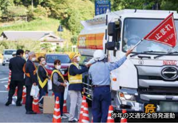
昨年の交通安全啓発運動